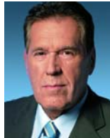
Michael Glos MdB

Unter dem Motto „Interdisziplinäres Denken als Erfolgsfaktor“ treffen sich die Wirtschaftsingenieure zu ihrem diesjährigen 8. Deutschen Wirtschaftsingenieurtag in der neuen BMW Welt in München. Interdisziplinäres Denken – das ist ein Erfolgsfaktor nicht nur für die Wirtschaftsingenieure, sondern für die Zukunftsfähigkeit unseres Landes insgesamt. Strategischer und grenzüberschreitender Austausch von Wissen dient der Stärkung von Innovation und Wettbewerbsfähigkeit.